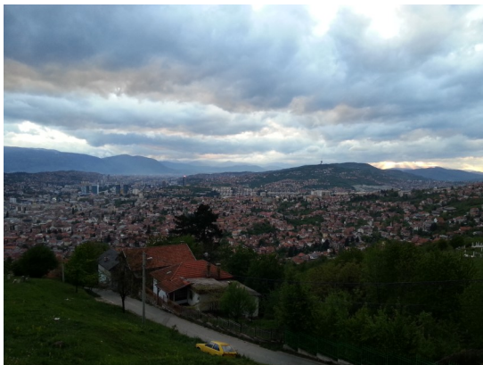
Vue sur Sarajevo