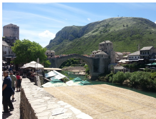
Pont de Mostar