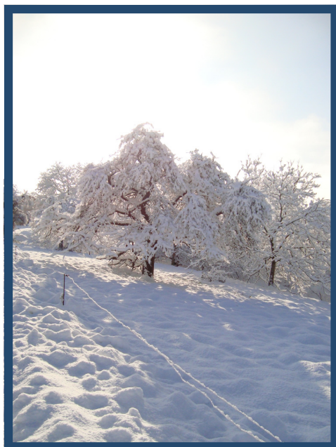
Belmont, le 1er janvier 2009